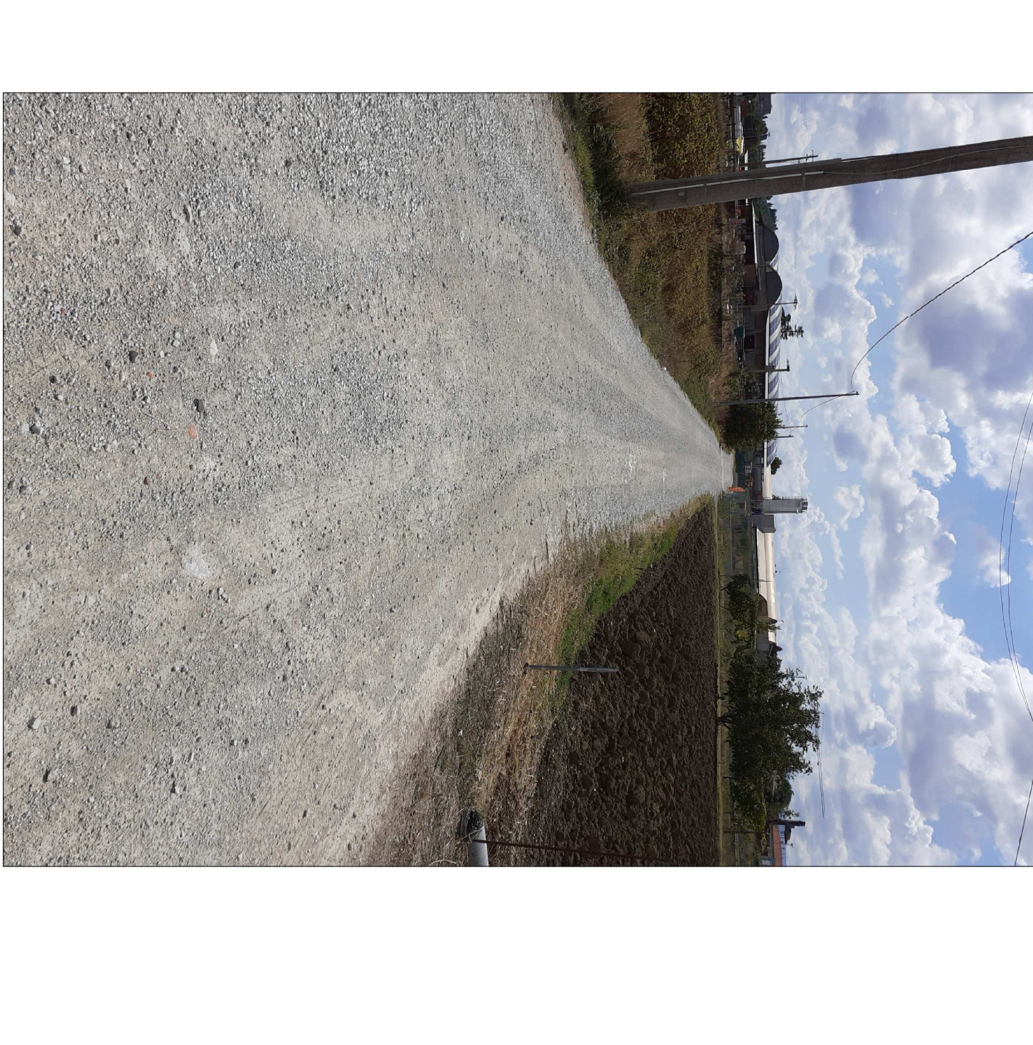
FOTO N. 7 Da via Morgi