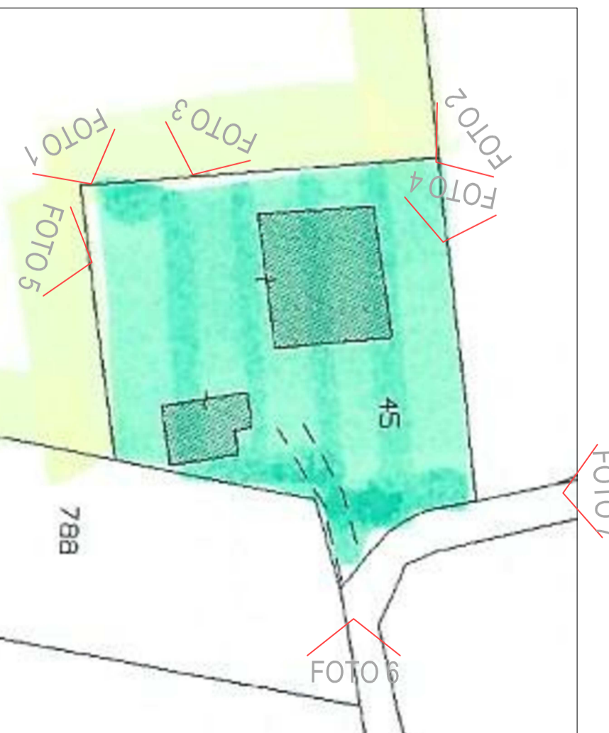
DOC. FOTOGRAFICA - PUNTI DI SCATTO